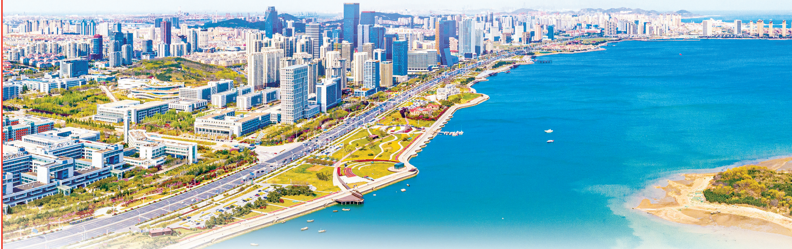
■航拍西海岸新区一角。