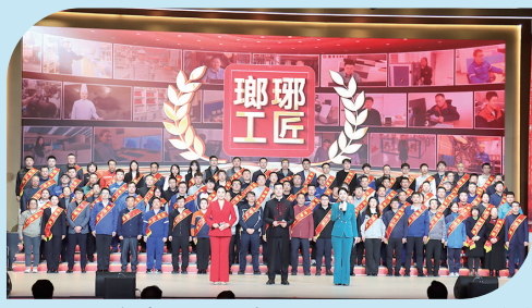
■西海岸新区举办第三届“琅琊工匠”培育成果展示活动。