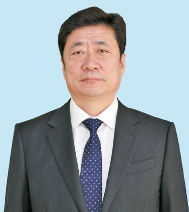
青岛市委常委,西海岸新区工委书记、区委书记 刘昌松

培育壮大先导产业、新兴产业和未来产业。制定差异化扶持政策,加快关键核心技术应用、基础设施建设和应用场景打造,推动集成电路、新型显示、人工智能等先导产业先行发展,生命健康、智能网联新能源汽车、低空经济等新兴产业融合集群发展,前瞻布局具身智能、氢能等未来产业,培育新的经济增长点。