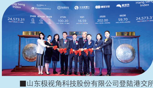
■山东极视科技股份有限公司登陆港交所,西海岸新区再添一家上市公司。

扩能提质现代服务业。突出需求牵引、改革攻坚、科技赋能、开放合作,深入实施服务业扩能提质行动,精准发力科技金融、工业设计、商务服务等领域,深耕总部经济、楼宇经济等业态,推进生产性服务业向专业化和价值链高端延伸;培育壮大转等转平台经济,建设直播电商、网约车、快递、家政等平台,促进生活性服务业高品质多样化便利化发展。