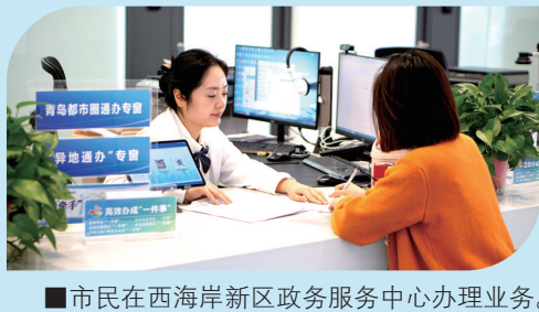
■市民在西海岸新区政务服务中心办理业务。