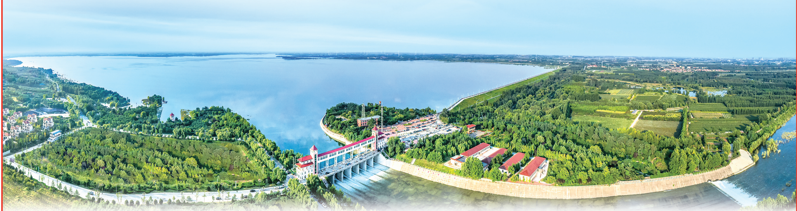
■风景如画的莱西湖。