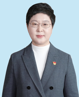
莱西市委书记 刘瑛

除了促消费，我们也在抓实投资、做强电商，双轮驱动扩内需。精准招商引项目，抓好重点项目建设，让更多好项目落地生根、带动就业；深耕电商经济，依托村书记直播带货，把莱西好品卖向全国，力争网络零售额突破100亿元。