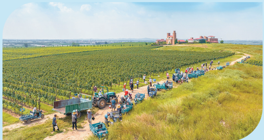
■莱西市院上镇九顶庄园。