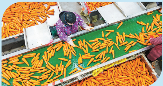
■莱西市店埠镇后屯村村民在清洗、分装胡萝卜。