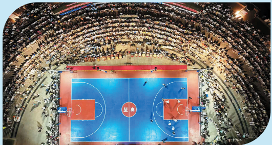
■“莱BA”篮球赛在莱西市人民广场火热举行。

说到底，就是以消费牵投资、以投资促消费，让内需潜力充分释放，让莱西经济既有“颗粒度”，又有“爆发力”，让群众在消费升级中共享发展红利。