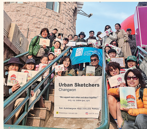
▲速写青岛与速写昌原的画友在信号山上合影留念。

芭蕾舞剧《吉赛尔》诞生于1841年，由法国作曲家阿道夫·亚当谱曲，以德国诗人海涅《论德意志》中的民间传说为蓝本，讲述乡村少女吉赛尔与贵族阿尔贝特的生死恋。剧中全方位呈现了芭蕾舞的精湛技巧，而故事里的爱情余韵也令观众动容。作为中央芭蕾舞团的经典代表作之一，《吉赛尔》的艺术传承刻入剧团的发展脉络。1960年，中央芭蕾舞团首次将这部经典搬上舞台；2014年，剧团重新制作排演，在保留原作原汁原味经典风格的基础上为其赋予了贴合时代的艺术特质，获得了芭蕾舞界的高度评价。 米荆玉