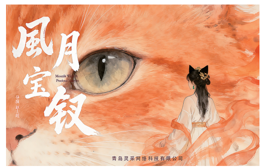
■AI 短剧《风月宝钗》海报。