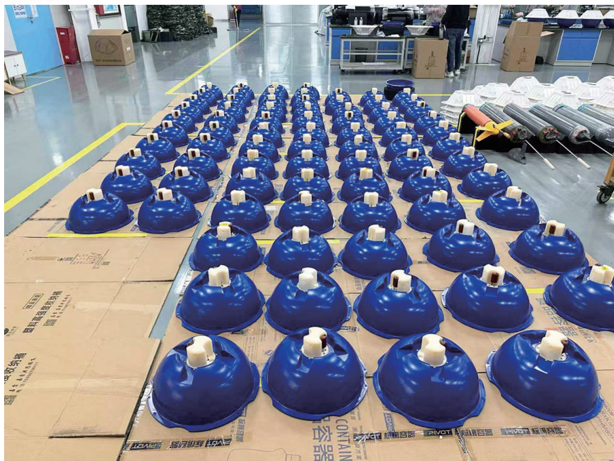
■表面漂流浮标装配现场。

这笔首贷的价值，在于印证了一种可能：金融能够精准识别、坚定支持那些“隐形冠军”，将自己的发展脉搏，接入国家科技进步与产业升级的大循环。