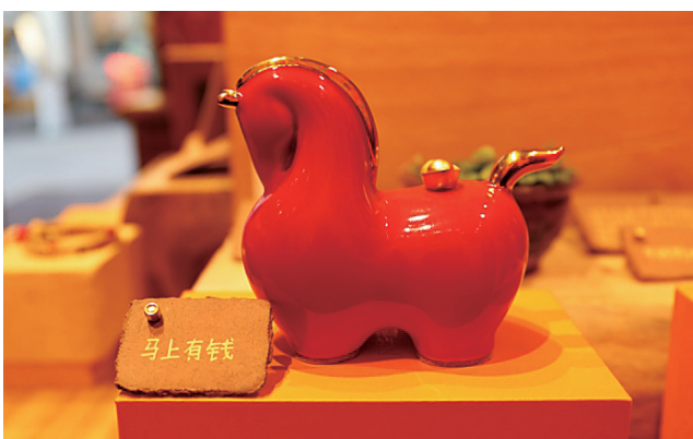
■在大鲍岛街区，“马”元素浓度飙升，各种象征马年祝福的文创产品上线。曹现梅 摄

腊月到，年味浓。景德镇基因的“马上有钱”陶瓷摆件、新潮寓意的非遗木板拓印、“Z世代”青睐的创意印章……在大鲍岛街区，“马”元素浓度飙升，各种象征马年祝福的文创产品上线，吸引不少市民游客前来乐淘年味。