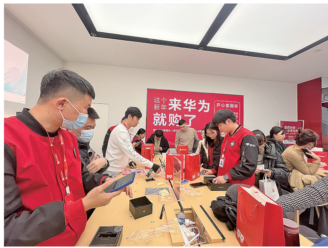
■“3C国补”落地，京东MALL迎来消费热潮。