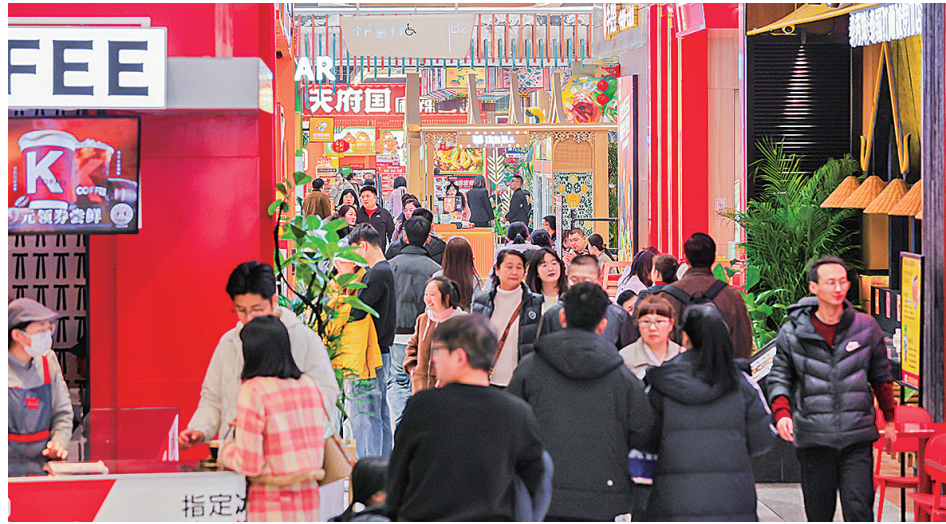
■凯德MALL丰富的消费场景吸引客流量。

承载百年港口开放基因的市北区，骨子里流淌着商贸繁荣的血液。对于市北区而言，消费一直是拉动区域增长、提升城区魅