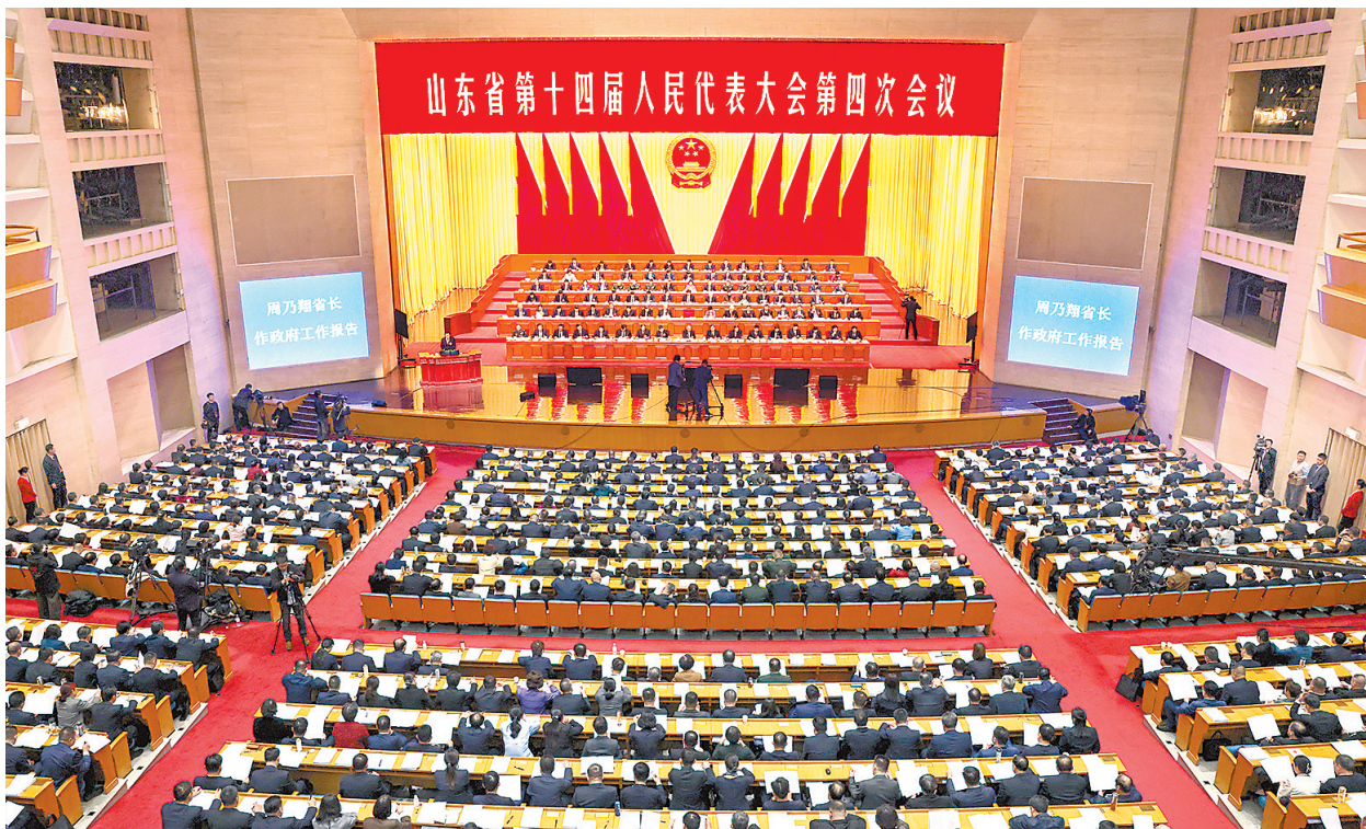
1月27日,山东省第十四届人民代表大会第四次会议在山东会堂开幕。任小杰 报道

们牢记嘱托、感恩奋进,从“走在前、开新局”到“走在前、挑大梁”,从实施“三个十大”行动到塑造“十个新优势”,一心一意谋发展、一以贯之抓落实,经济综合实力、现代化产业体系、科技创新能力、美丽山东建设、基础设施建设、城乡区域协调发展、文化繁荣发展、人民生活水平实现新跃升。全省地区生产总值年均增长5.9%,经济总量连续跨越3个万亿元大关,人均生产总值由7.34万元提升至10.26万元,增长34%。“十四五”圆满收官,新征程上现代化强省建设实现良好开局。