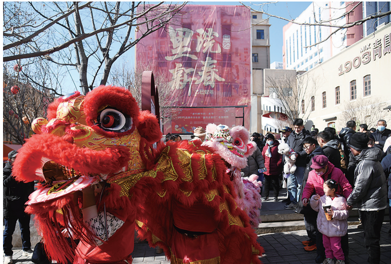
随着新春佳节的临近，岛城一系列节庆活动将陆续与市民游客见面。图为在青岛老城举办的迎春活动。本报资料照片

青岛的节日，既有山海之间的壮阔气象，更有街巷深处的热闹温情。在沉淀着百年故事的老街里院与历史城区，青岛市将举办“第四届新春逛街里节”、2026青岛市“萝卜·元宵·糖球会”、通过沉浸式情景巡游、老字号品牌回归、主题艺术展览、非遗手造市集等形式，展现青岛冬日的人文景观和历史风貌。根植于乡土的传统民俗，是春节的灵魂所在。一系列承载着青岛人集体记忆的民俗活动将如期而至。节日期间将举办青岛天后宫第27届新正民俗文化节庙会，以传统仪式和民间艺术展演祝福国泰民安。各区市也将开展极具地域特色的民俗活动，充分展现胶东地区深厚的海洋文化与农耕文明，延续最地道的青岛年俗。