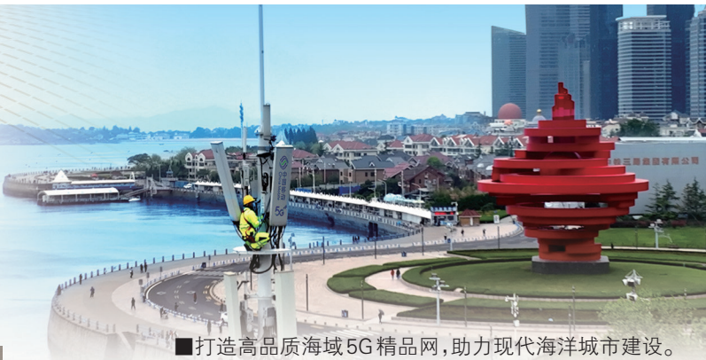
■打造高品质海域5G精品网,助力现代海洋城市建设。