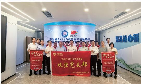
■保障团队助力青岛市政务服务便民热线全面升级。

通过整合全市1400余项诉求分类标准、3500余条政策法规及800余条部门职责清单,并融合3500余万件历史诉求案例,青岛移动构建了完整的政务服务知识体系。系统上线后,有效压缩了工单处理时长,推动了诉求办理流程的标准化、智能化转型,彰显了中国移动在政务数字化领域的技术实力与服务担当,为青岛市打造高效、便民的政务服务新生态提供了坚实支撑。