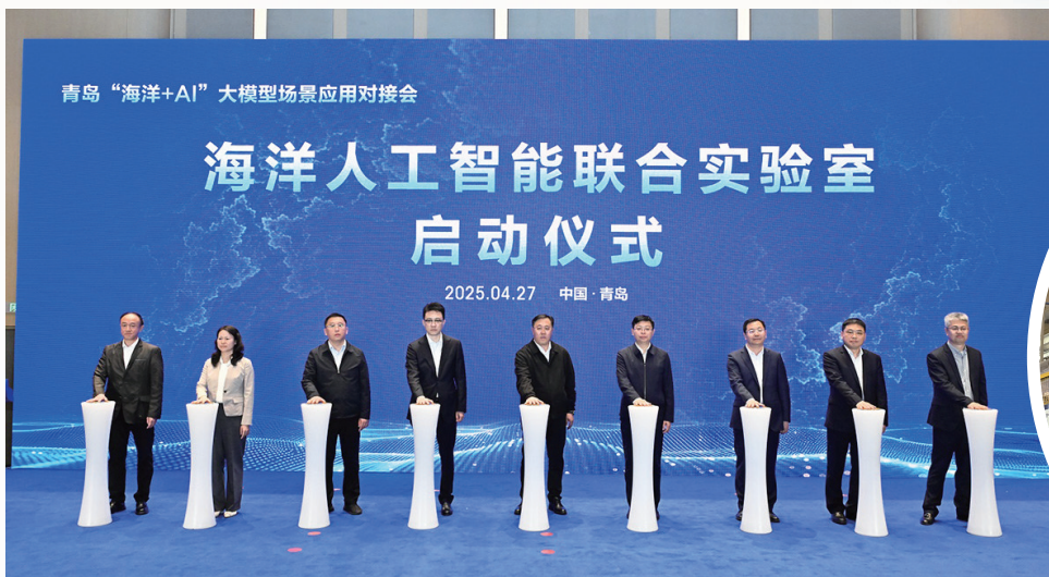
■海洋人工智能联合实验室启动仪式现场。

当前,新一轮科技革命和产业变革深入推进,数字经济正成为引领经济社会发展的核心引擎。2025年,青岛移动作为数字青岛建设的“国家队”和“主力军”,始终坚持创新驱动发展,聚焦5G-A、人工智能、工业互联网、海洋经济等关键领域,加快推进新型基础设施建设,积极培育壮大新质生产力,为青岛建设社会主义现代化国际大都市注入了强劲的数字动能。