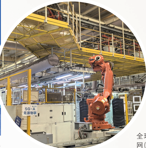
■携手海尔集团打造全球首个5G-A无源物联网(PloT)样板工厂。