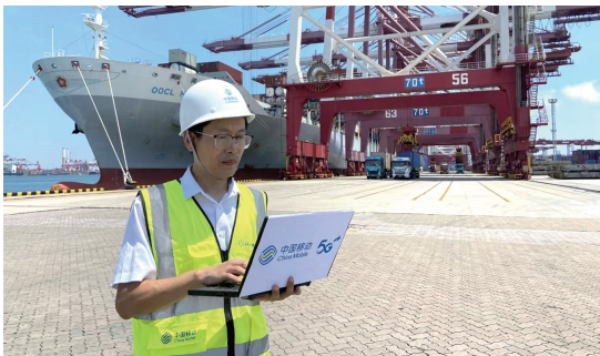
■赋能海洋交通运输领域打造智慧船舶系统。