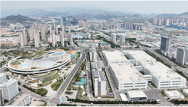
■比邻而居的虚拟现实创享中心(左)与虚拟现实整机和光学模组项目(右)。