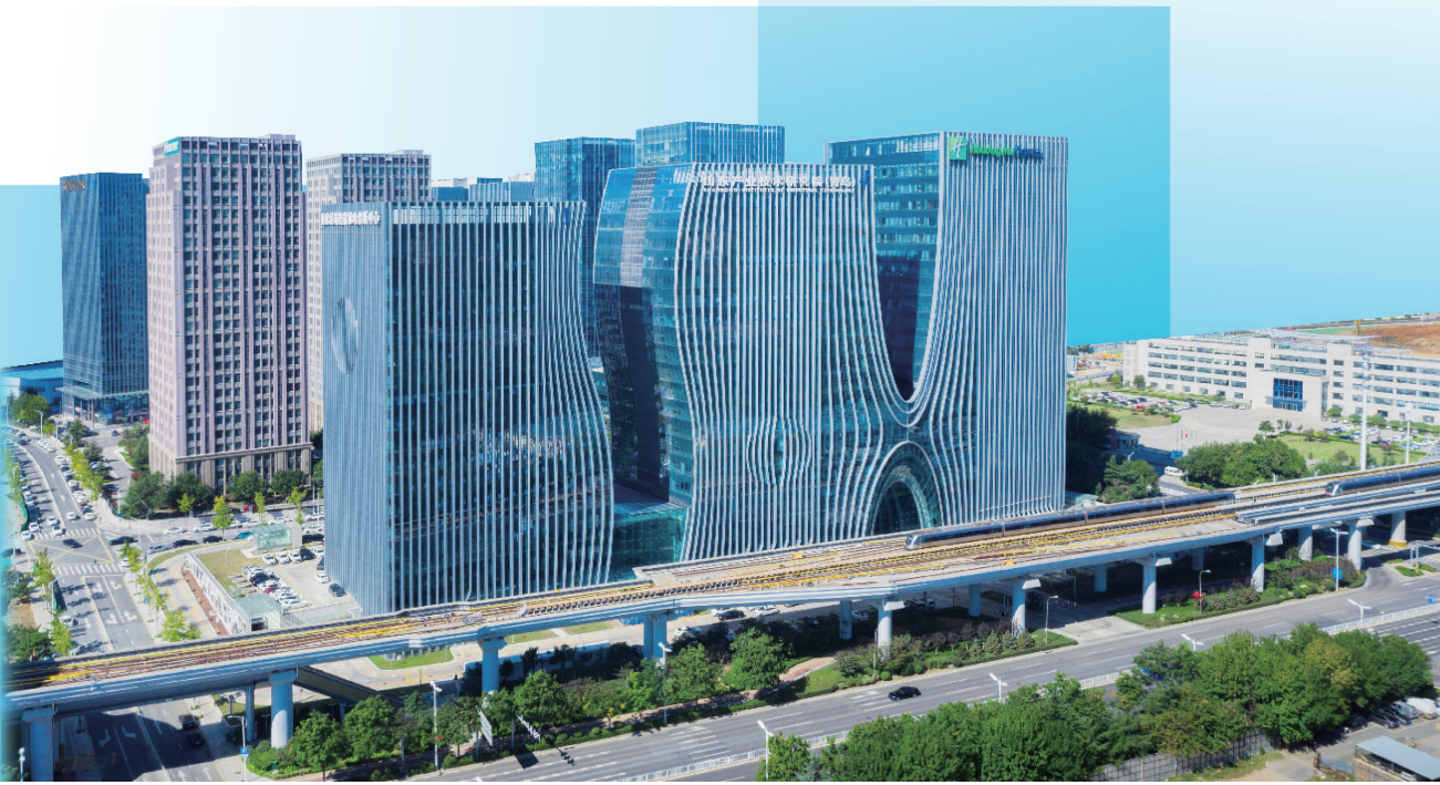
■青岛市人工智能产业园一隅。