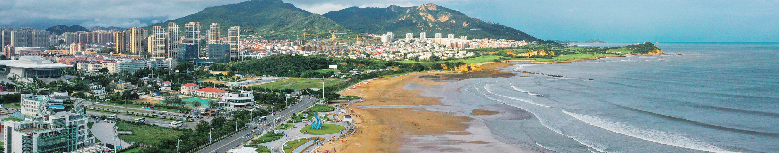
■山海相依的崂山城区。