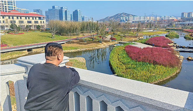
■张村河成为市民“河景出片打卡点”。