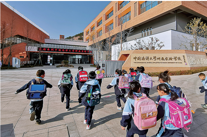
■中国海洋大学附属实验学校建成投用。