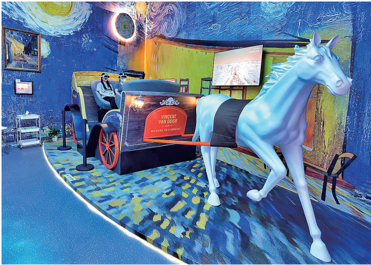
■市民在Wemake XR梵高数字艺术体验馆用XR技术欣赏梵高的作品。

在数字化浪潮下，传统景区正面临体验同质化、吸引力下降的挑战。面临困境，很多景区选择利用科技赋能，而科技赋能的核心，不应是“技术堆砌”，而是通过虚实共生、情感共鸣、生态可持续的方式，重塑游客与景区的连接方式。在这一背景下，青岛世博园睡莲世界园去年增设Wemake XR梵高数字艺术体验馆，走上一条“自然美学+数字艺术”的创新路径。