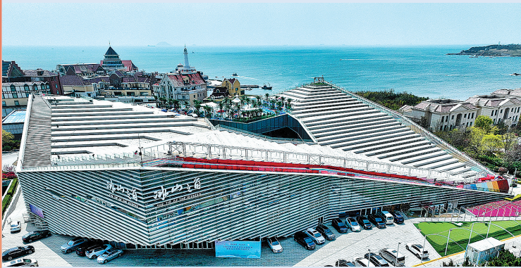
■位于“冰山之角”的海尔世界家电博物馆。