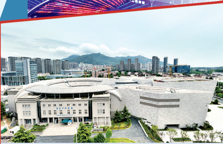
■航拍青岛市博物馆。

在科普教育和研学课程方面,博物馆走出了特色之路。依托2.4万余件馆藏,博物馆打造了涵盖数学、中医药、国学等32门学科的“小贝壳大世界”主题课程,年均开展科普活动超1000场次。2024年推出的《贝壳说中国》一书,以贝壳为媒串联历史、民俗等知识,让科普更具深度与趣味性。“贝精彩”研学课堂融合讲解、游戏与手工DIY等形式,将贝壳分类、贝类与海洋环境等内容纳入20余门课程。