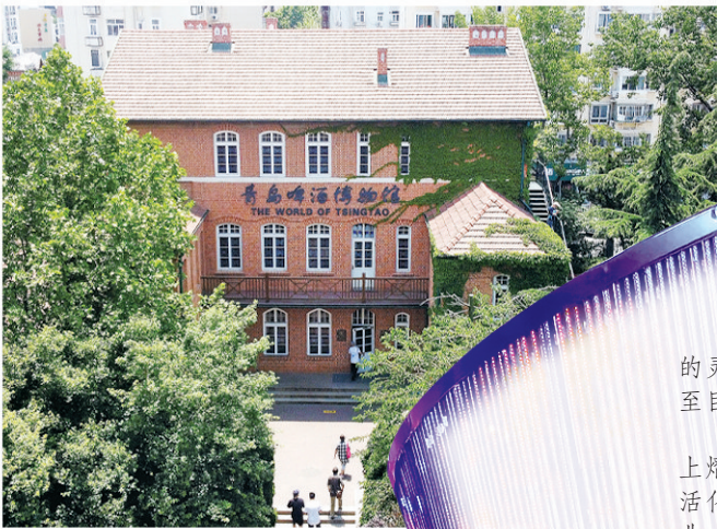
■青岛“博物馆+文旅”标杆项目——青岛啤酒博物馆。