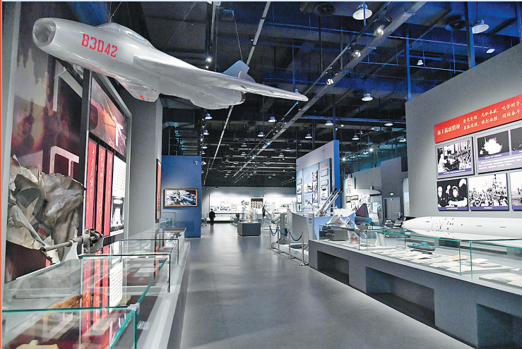
■海军博物馆以海军发展史为脉络。