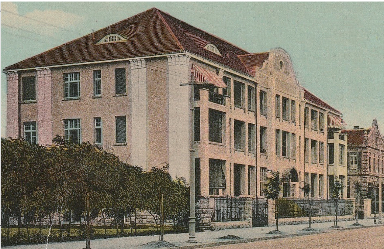
■1912年6月竣工并投入使用的客房楼（栈桥宾馆）设计手法严谨、体量方正，展现出当时流行的青年风格派特点。