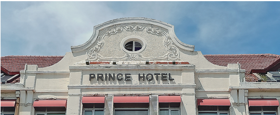
■太平路31号客房楼的弧形山墙，围绕装饰的花草纹饰，既体现出青年风格派特点，也进一步强调了中轴对称。

根据最新的项目改造概念规划和设计方案，太平路31号将与西邻的太平路33号，即原青岛报业集团大楼一同重新规划和设计，按照国际化高标准进行业态提升，未来将改造成一座区位优势突出，文化底蕴深厚，具有青岛特色的高品质酒店。