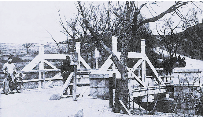
■由东营盘向南过桥，与伊尔蒂斯关大街相交汇的阿里拉街（Alila Strasse），即今鱼山路。

1922年，青岛主权回归中国后，这条山间小道被命名为西山路。上世纪五十年代初，又更名为延安一路，并进行了取直、拓宽。与今天的道路走向进行比对，除了登州路至延安路的这段与延安一路重合，德租时期鹰鸢街的其他部分，在依山敷设的地势之外，已不复昔日的旧貌。