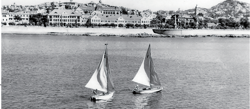
■1950年代，太平路31号客房楼曾为青岛市妇联等机构办公场所。

2024年6月初，青岛市公共资源交易电子服务系统发布的改造项目招标计划，让这座闲置已久的老房子重回公众视野。2025年9月，青岛市自然资源和规划局也发布了《关于对太平路31、33号改造项目建设工程设计方案进行社会公示的公告》。不过，在各类自媒体的相关报道中，说法各异的沿革与考证却让人倍感无奈。这座百年老楼究竟出自哪位建筑师之手，又是谁因何投资建造了它？一百多年来的岁月流转，它又经历过怎样的陈年往事？让我们拂去历史资料上的尘与土，一探究竟。