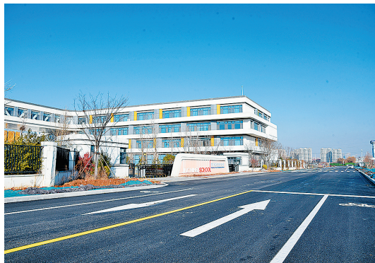
■景明学校正门前的规划十四路已具备通行条件。

“路通了，安全隐患少了！”近日，位于城阳区景明学校东门前的道路（规划十四路）已满足通行条件，该校学生家长为此点赞，并希望校方早日开放东门。