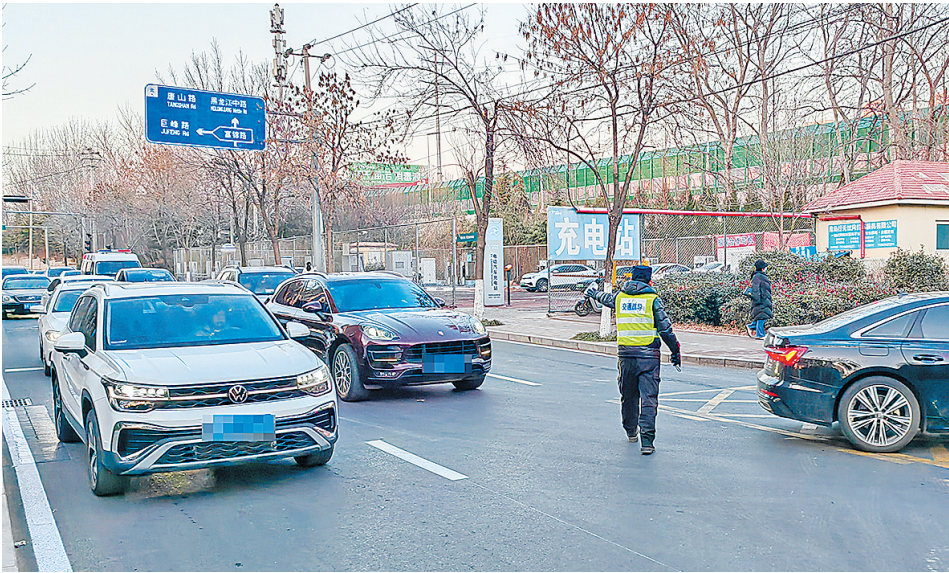
■交通疏导员在月龙峰路疏导车辆。

线同步通车，车辆不能提前分流，而东方龙城桥洞为双向两车道，通行能力有限，在早晚高峰时段，小区居民通行需求大，多重因素叠加，致使月龙峰路发生暂时性交通拥堵。