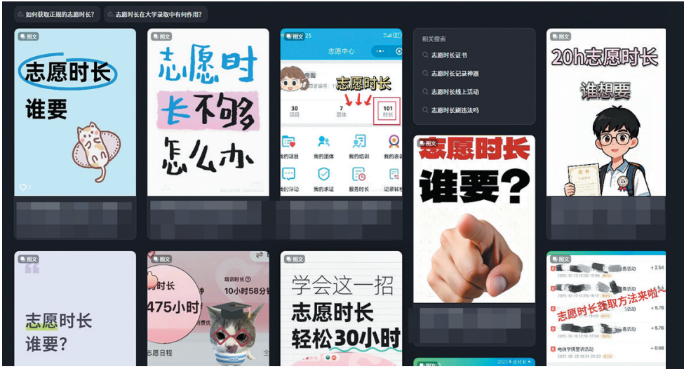
■某网络平台上有大量与志愿服务时长相关的帖子。

志愿服务是公益行为，将志愿服务引入教育评价体系，本意是培养学生的社会责任感与奉献精神。这种服务为何被明码标价，成为可以买卖的商品，甚至形成灰色产业链？如何让学生志愿服务这堂课真正落地？记者展开调查。