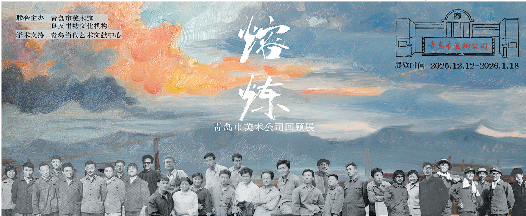
■青岛市美术公司回顾展海报上的人物群像。