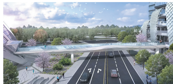
■青岛国际邮轮港区空中连廊效果图。