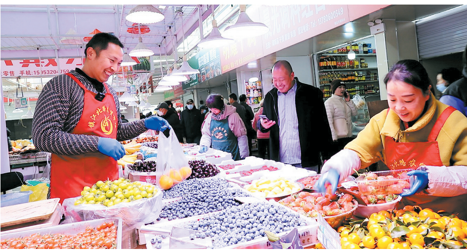
■焕新后的镇江北路农贸市场。