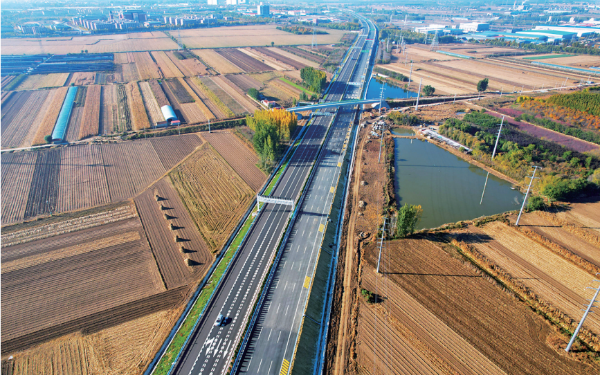
■12月30日，沈海高速南村至青岛日照界段改扩建工程主线通车。

沈海高速公路(G15)是国家高速公路网的骨架部分，是《国家公路网规划》中11条南北纵线的“纵二”线，地位非常重要。沈海高速南村至青岛日照界段改扩建工程起自平度南村枢纽互通，止于沈海青岛日照界，经过平度市、胶州市、西海岸新区，全长131.45公里，设计速度120公里/小时，采用“两侧拼宽为主，分离加宽为辅”加宽方式，由以前的双向四车道改扩建为双向八车道，工程投资概算180亿元。2022年12月底，项目节点工程开工。2024年12月31日，工程大幅实现通车。今年11月，工程在幅部分路段——南村枢纽至马店枢纽、胶州收费站至铁山收费站、董家口枢纽至青岛日照界段三大核心区间提前通车，实现了项目南段与沈海高速日照段提前衔接，强化了青岛西海岸新区与日照市跨区域联动。