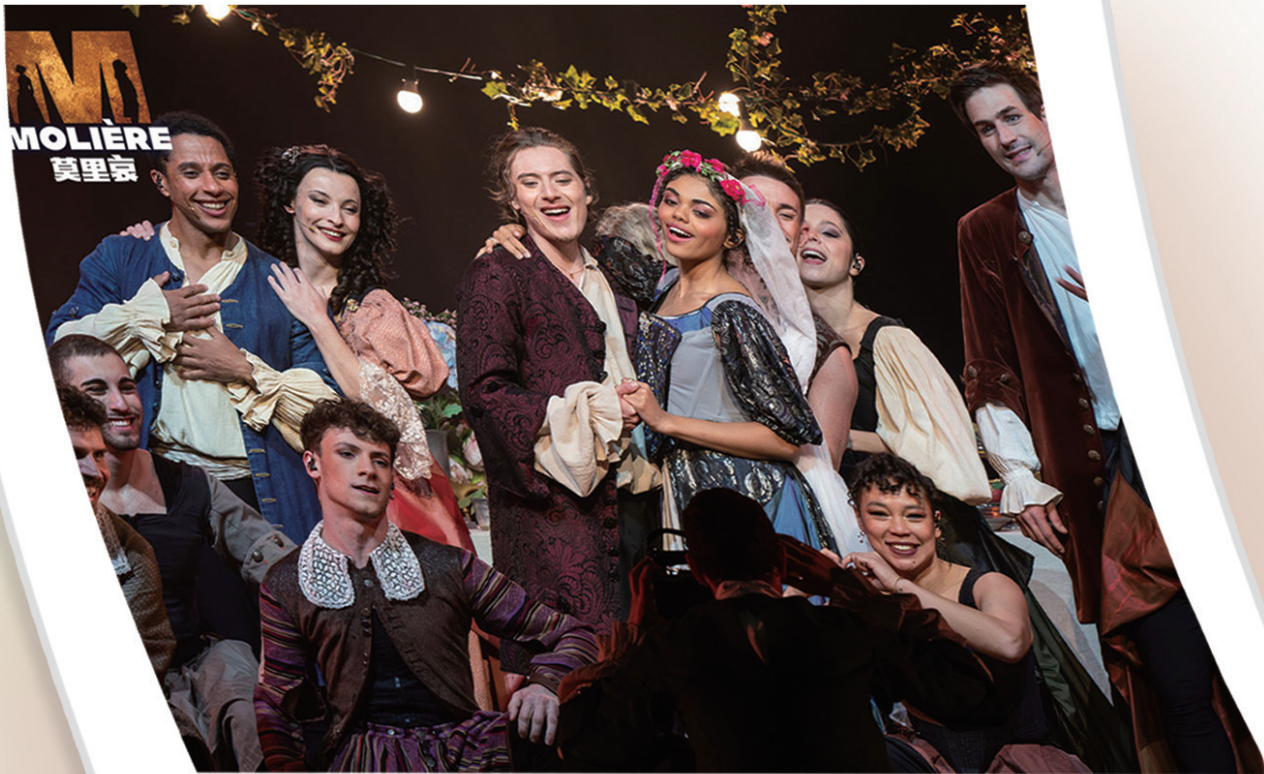
■法国原版音乐剧《莫里哀》剧照。

回顾2025年的青岛文化产业,头部项目资源高度聚合、精品化战略成效凸显、本土人文特色深度融合、国际化水准显著提升,实现了从影视创作、短剧承制到IP孵化的链路通畅。2026年,青岛文化产业进入扩规模、提能级、融科技、强输出的跃升阶段。在实现演艺经济高效多元的同时打造全国性内容生产与展演枢纽,2026年将是尤为关键的一年。