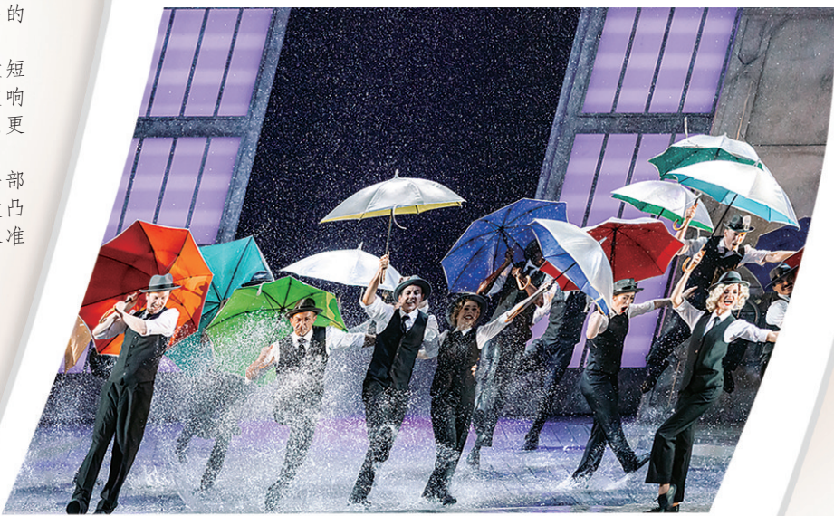
■伦敦西区原版音乐剧《雨中曲》剧照。