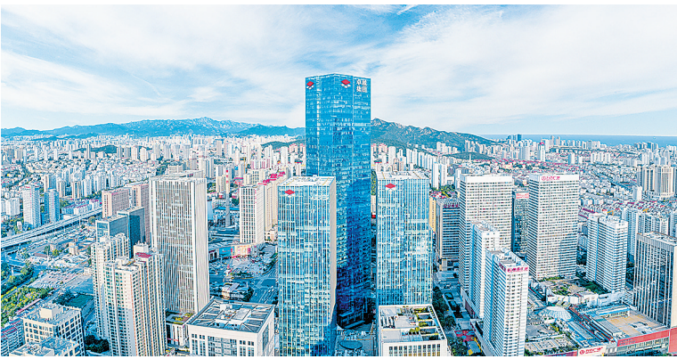
■青岛中央商务区成微短剧产业高地。