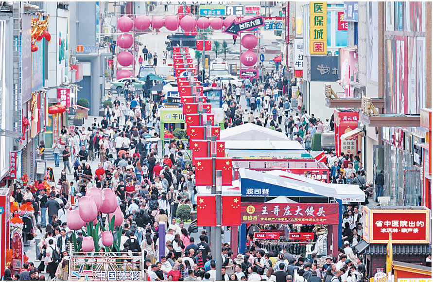
■国庆中秋假期,台东步行街人潮涌动。

市北区的消费版图还在多维拓展——中免免税店青岛城市店构建“口岸+城市”免税体系;山东首家小米汽车交付中心、胶东半岛规模最大的理想汽车交付中心、全国首批华为鸿蒙智行全生态展馆相继开业,形成新能源汽车品牌矩阵;LAC来舞演艺中心、中车四方文化科技馆等工业文旅新地标顺利落成;希尔顿欢朋等13家中高端商务酒店今年开业,提升区域商业接待能力与城市形象;凯撒旅业、北京恒信、启航计划等邮轮领域龙头旅行社相继落地,青岛国际邮轮港区成功获批北方唯一的国家级国际邮轮母港消费设施建设和场景提升试点,邮轮产业从“交通枢纽”向“文旅消费地标”战略转型。