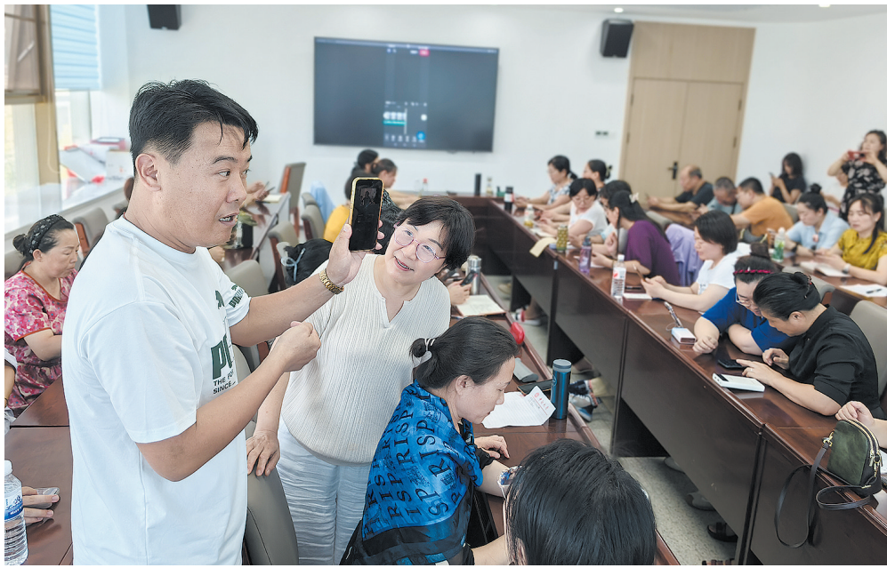
■《手机视频拍摄与剪辑》课堂现场。

基层治理是国家治理的基石,直接关系到社会稳定与群众福祉,其复杂性源于千头万绪的具体事务与差异多元的群众需求。