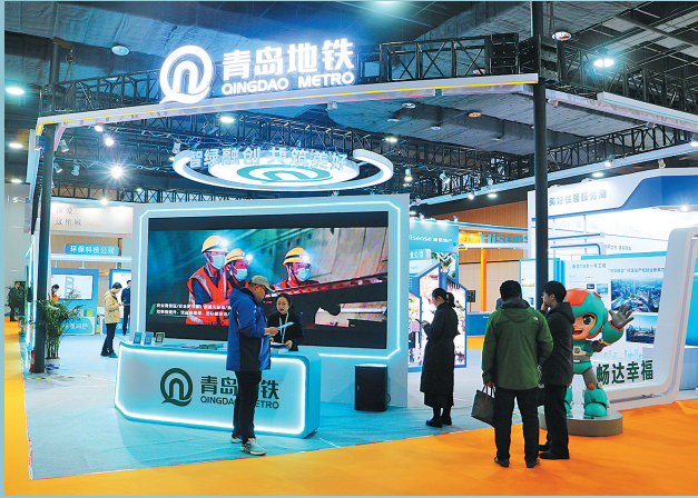
■青岛地铁展位汇聚“青小铁”、智绿融创等元素。