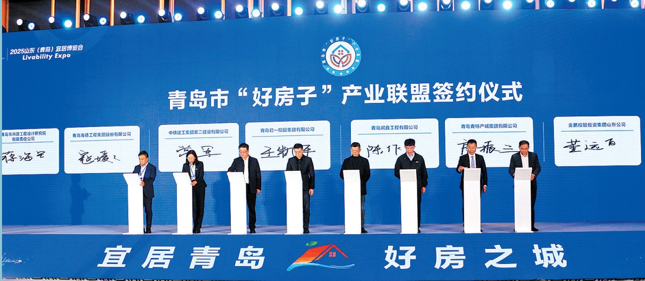
■宜博会上，青岛市“好房子”产业联盟签约。

本届宜博会由中国房地产业协会、中国建筑节能协会、中国勘察设计协会、青岛市住房和城乡建设局指导，青岛日报报业集团、山东省房地产业协会、山东省建筑业协会、山东省勘察设计协会联合主办。一个个特色展区、一场场论坛演讲，凝聚着青岛宜居安居的智慧和力量，更传递着这座城市迈向高质量发展新境界的信心与决心。