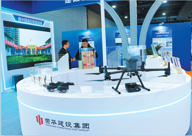
■参展企业展示智能化建设设备。