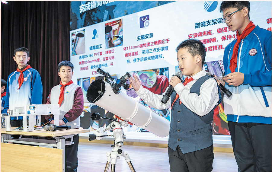
■青岛二十六中教育集团的初中生与小學生联合展示创新发明成果。

民生无小事，枝叶总关情。2025年，市南区锚定群众急难愁盼，聚焦卫生健康、养老托育、教育就业等关键民生领域多点发力，将政策红利精准滴灌到民生一线，通过织密服务网络、创新服务模式、提升服务质效，让康养有依靠、托育有温度、教育有品质、就业有支撑，全方位筑牢民生幸福根基，以一件件民生实事落地、一项项服务举措升级，交出一份温暖厚实的民生答卷。