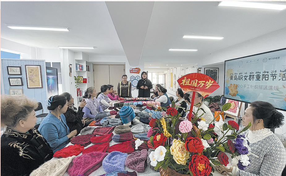
■仰口路社区青岛织女群重阳节活动。