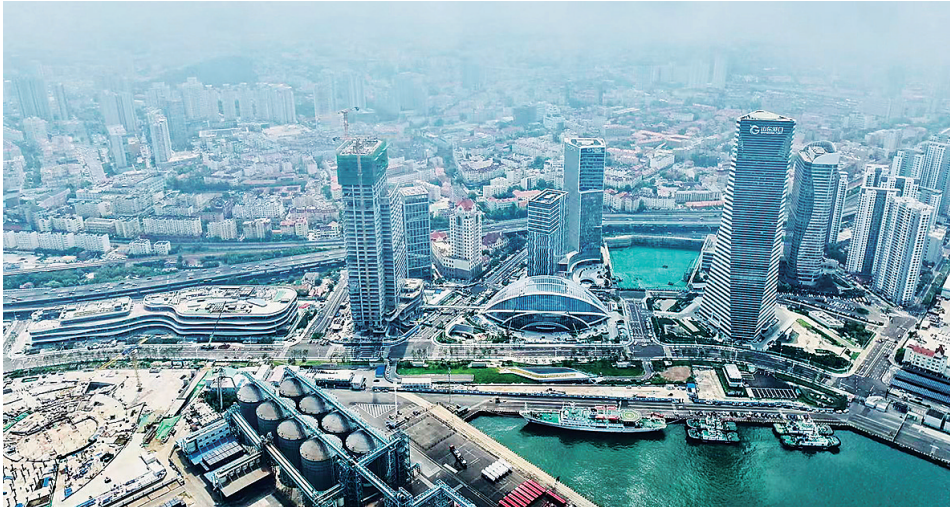
■青岛国际邮轮港区启动区。

等地区的精品航运通道；通过“油运巴士”品牌开展内外贸油品运输业务，形成大宗散货“陆海联动、南北贯通”的物流体系。