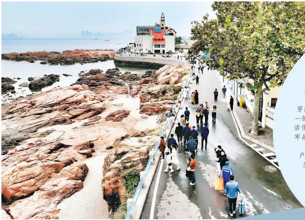
■秋冬时节，琴屿路别有一番韵味。