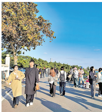
■市民游客漫步在琴屿路上，享受恬静时光。