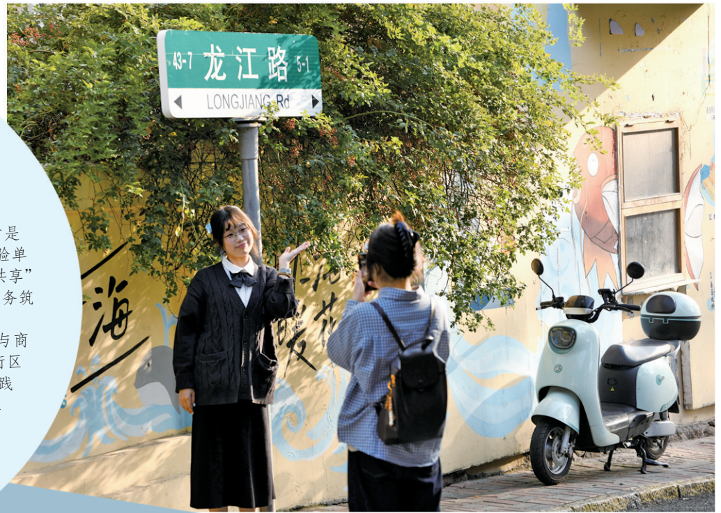
■年轻游客在龙江路定格美好回忆。

当琴屿路的滨海浪漫定格成镜头里的美好回忆，当龙江路漫画墙与老建筑碰撞出文艺火花，青岛网红路早已超越打卡地标，成为城市文旅发展的重要载体。 网红经济中，“爆红”是流量瞬时集聚，“长红”才是穿越周期的核心命题。面对业态同质、热度易散、体验单一的挑战，青岛网红路亟需跳出“打卡依赖”，以“主客共享”活化历史肌理，以“文旅+”思维打破边界，以精细化服务筑牢品质，让网红路的活力穿透四季、摆脱淡旺季桎梏。 近日，记者深入琴屿路、龙江路等代表性街区，与商户、居民、文旅从业者及专家学者深度对话，记录街区生长的真实轨迹，倾听不同层面的转型诉求与实践构想，期待通过梳理这份多元声音，为青岛网红路突破发展瓶颈、实现长效繁荣提供一份兼具现实参考与实践价值的思路借鉴。