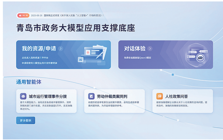
■数字青岛打造的通城政务大模型示意图。

目前，数字青岛组建了专业从事大模型技术研究及城市云脑开发的团队，进行城市治理场景创新应用研发及相关产品验证，通过打造大模型底座及应用场景，有效提升政府决策科学性、公共服务高效性与城市治理协同性。