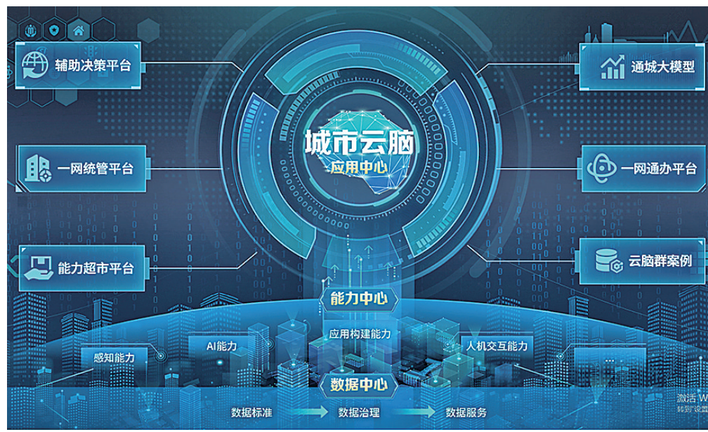
■数字青岛打造的城市云脑示意图。

数据与人工智能是共生共荣的“双螺旋”。数据作为一种关键生产要素，要投入到社会生产中并产生价值，几乎每一个环节都离不开人工智能的赋能。因此，除了发展数据要素产业之外，数字青岛的另一重要使命就是通过数据高效流通来丰富人工智能应用场景。