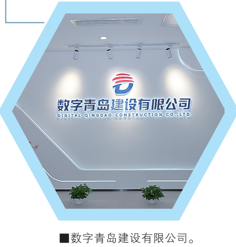
■数字青岛建设有限公司。

随着更多合作的展开，数字青岛的辐射力与引领力也将超越城市边界，在更广阔的区域协同中释放数据价值。