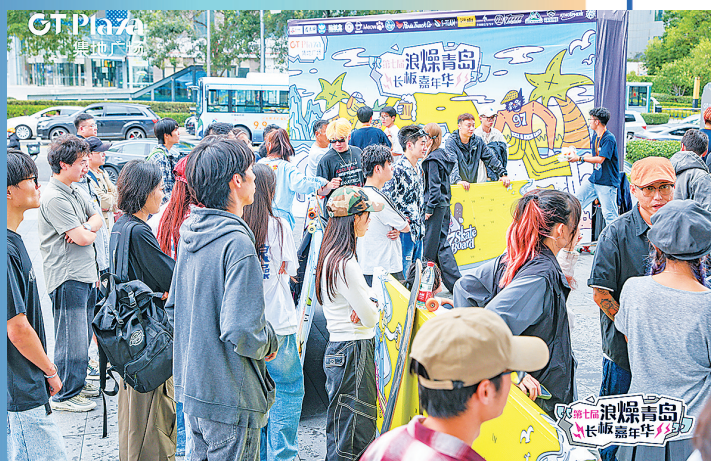
■绿城青岛GT PLAZA 集地广场诸多促销引得市民游客纷至沓来。