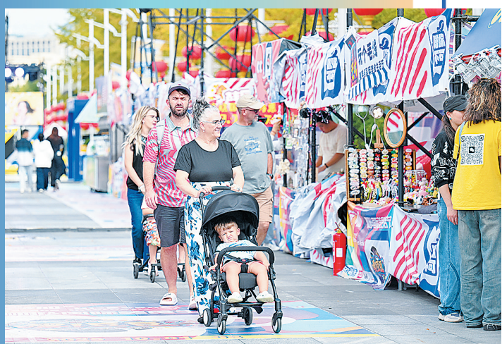
■市民游客乐享2025奥帆咖啡&国际美食生活节。