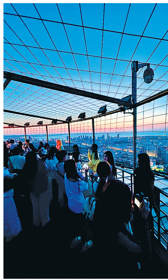
■青岛电视塔风光无限。

“双节”期间，市南区顺应消费个性化、主题化、圈层化趋势，打造出各具特色的消费场景，满足不同群体的差异化需求。