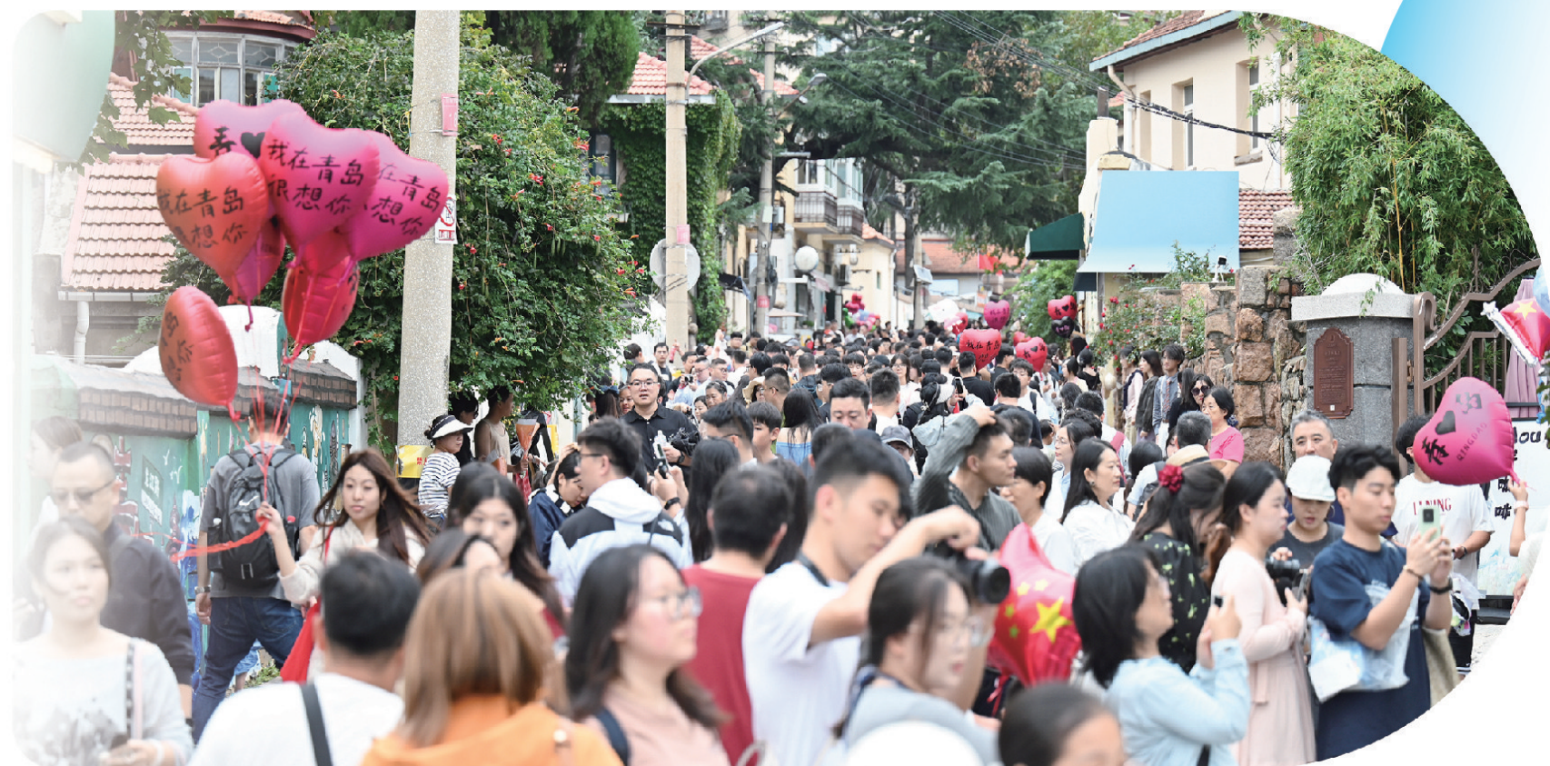
■龙江路人流如织，摩肩接踵。