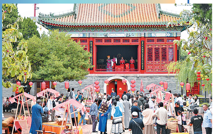
■游客在天后宫欣赏民俗演出。