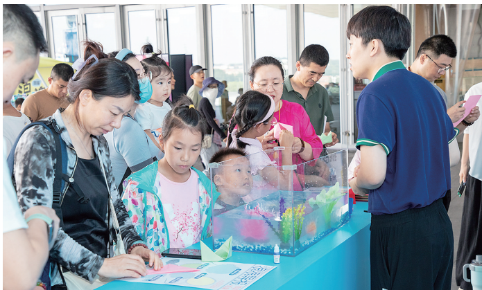
▲“浪浪开海节”启幕现场，“和郑和一起开海”科学快闪。