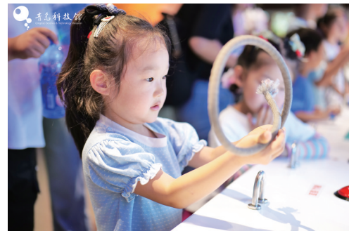
■ 孩子在“航海训练营”环节学习制作水手结。

2025年正值郑和下西洋620周年，青岛科技馆也借此节庆以古鉴今，联动山东博物馆、青岛市博物馆等单位，打造了久久公益节“数字文物全民守护行动”公益践行区，开启了历史与科技的对话，让