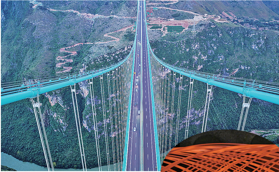
▲9月28日，车辆行驶在已正式通车的贵州花江峡谷大桥上。