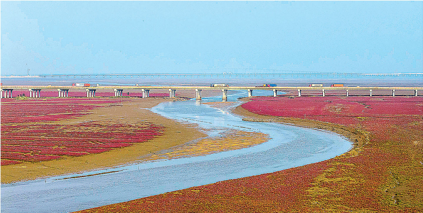
■近日，西海岸新区红石崖街道附近的胶州湾湿地红海滩，迎来一年中的最佳观赏期。

当中秋的明月邂逅国庆的盛景，当山海的壮阔碰撞不夜城的璀璨，这个“双节”，青岛山海间不夜城主题街区备好一场跨越“古”与“今”、融合“国”与“家”的沉浸式盛宴，十大主题活动邀请市民游客加入节日的欢乐时光。《唐宫夜宴》《一梦惊鸿》等国风经典将华丽上演，带市民游客感受流淌在血脉里的美学共鸣。在中央电音广场东北侧，月映山海烟花秀将精彩登场，绚丽的烟花将在山海之