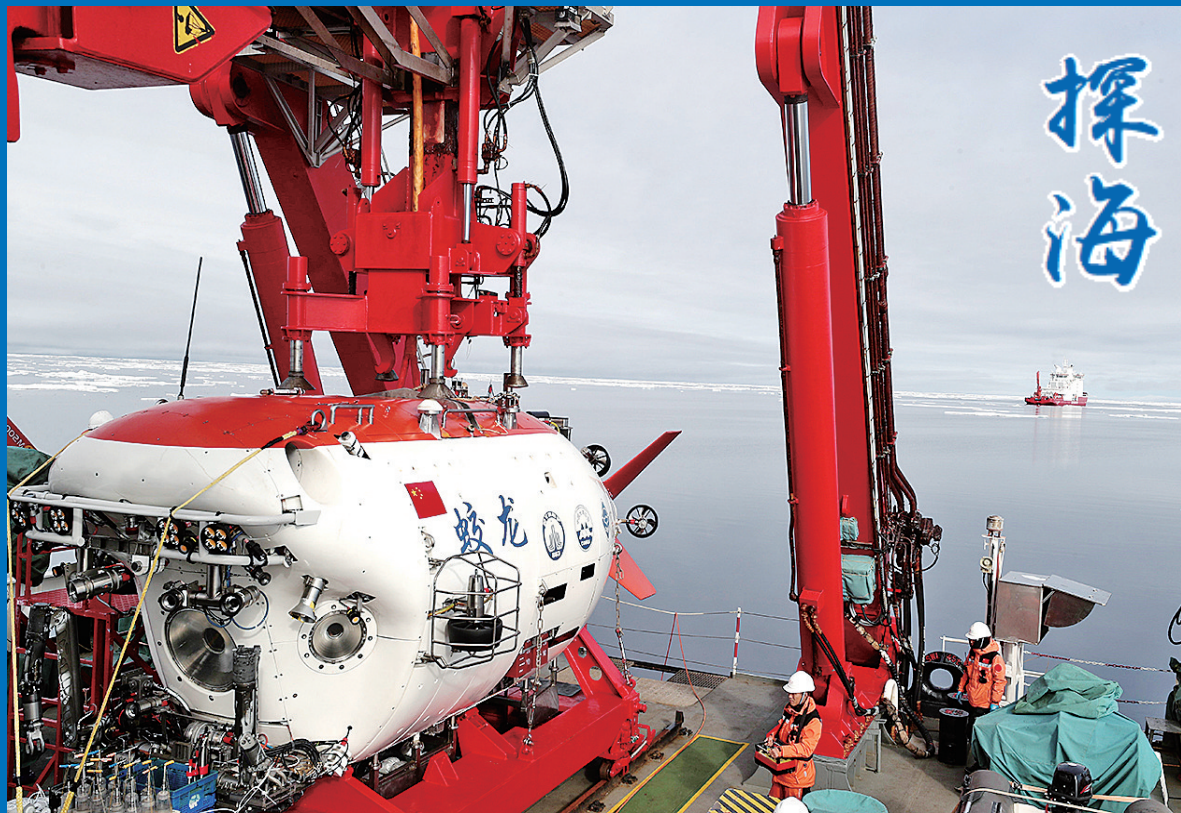
■“蛟龙”号准备离开母船“深海一号”(8月6日摄)。