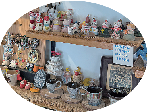
▲店内的自制陶偶。 ▲“陶里陶气”手作店。

除DIY体验外，店铺还开设陶艺课程，主要面向零基础小朋友，也兼顾成人需求，内容涵盖认识泥料、学习制作工艺、掌握釉下彩上色及化妆土雕刻等技巧。课程采用预约制，每周依预约人数安排，分三节与六节系列。其中，三节课程适合低龄儿童，以实践为主，助其形成陶艺基础认知，通过触摸泥土感受触感与烧制效果；六节课程讲解更细致，适合大龄儿童与成人，可深入学习陶艺知识与技能。