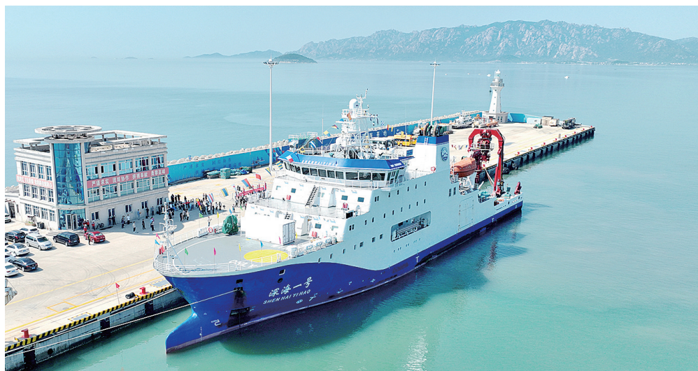
“深海一号”船停靠在国家深海基地管理中心码头。