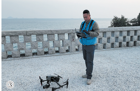
图③青岛市环境保护科学研究院工作人员利用无人机开展“智巡海湾”工作。