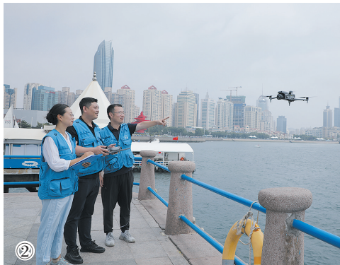
图②无人机搭载“智巡海湾”系统，实现海湾生态环境全链条闭环巡查机制。