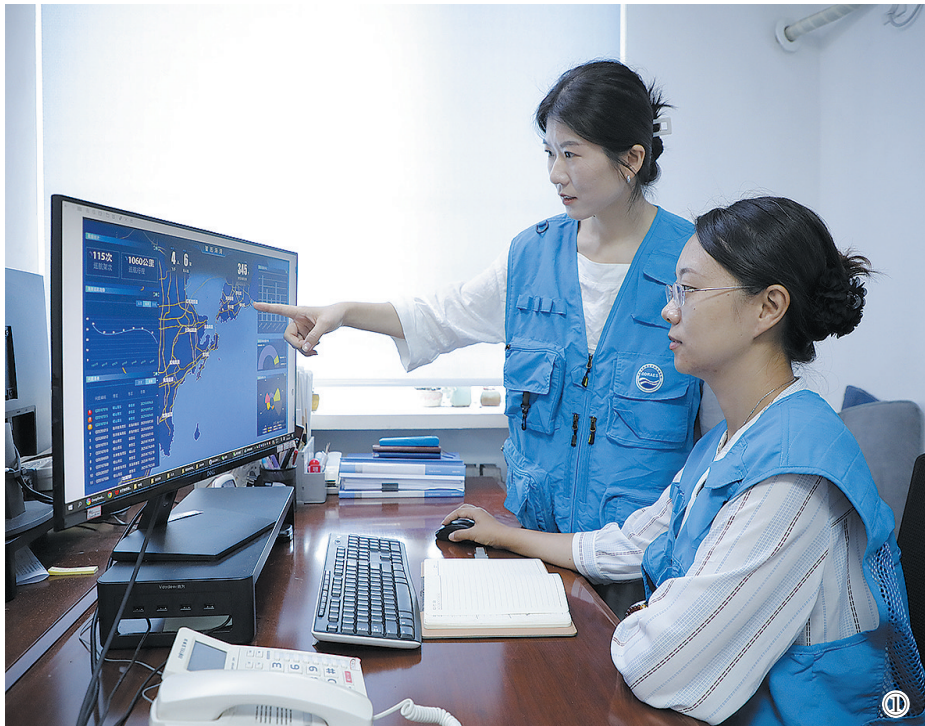
图①青岛市环境保护科学研究院科研人员通过“智巡海湾”系统精准识别海湾生态环境问题。