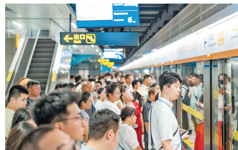
■进入暑期，青岛地铁不断创下客流量新高。

□青岛日报/观海新闻记者 周建亮 文/图 本报8月13日讯 青岛进入旅游旺季以来，山海美景、啤酒节等文旅热点持续升温，众多游客将地铁作为高效出行的首选，推动地铁客流量强劲增长。