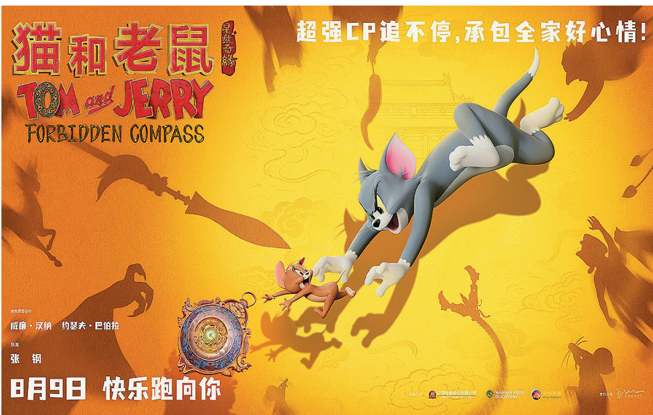
■《猫和老鼠：星盘奇缘》将中国文化注入“猫和老鼠”这一经典IP。

借由暑期档的票房数据可以看出，动画电影在电影产业的占比越来越高，动画电影人对行业