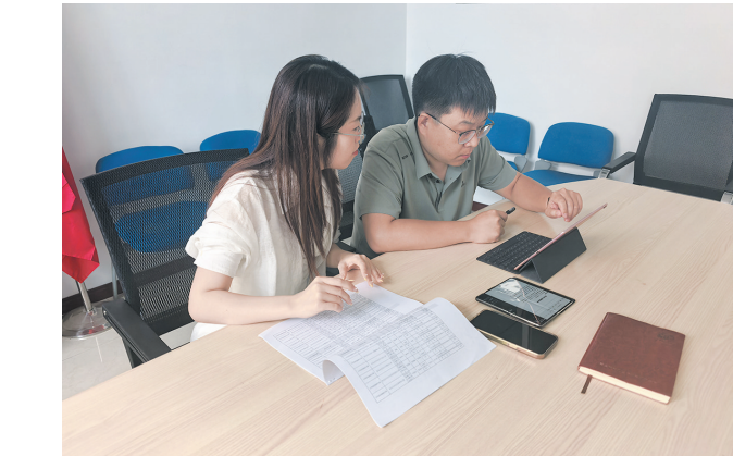
■市北区行政审批服务局工作人员在“直播小课堂”上讲解幼儿园延续办学业务。

办事市民在炎炎夏日少跑一次,市北区行政审批服务局研究定制了一套专属审批方案,整合业务材料,优化审批流程,将审批通过的