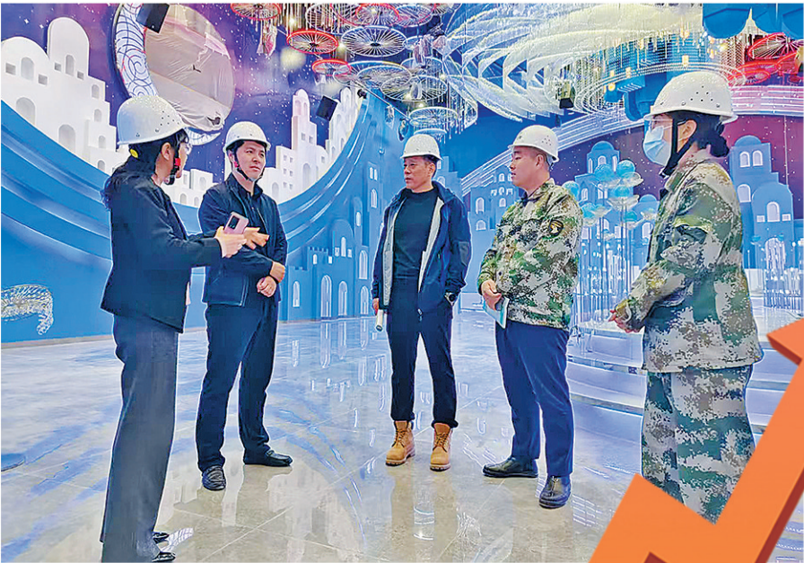
■海伦路街道工作人员实地走访东方铭悦婚礼堂项目，帮助企业解决实际问题。

下一步，海伦路街道将依托业务主管部门、市北税务、疾控中心、动卫中心、六医等驻街优势，以山东路、南京路、重庆南路为主轴，突出特色业态培植，以科技创新和生物医药为发展“双引擎”，聚焦市场所需、企业所想，全力擦亮“汇海兴企”营商服务品牌，打造创新创业最优生态。