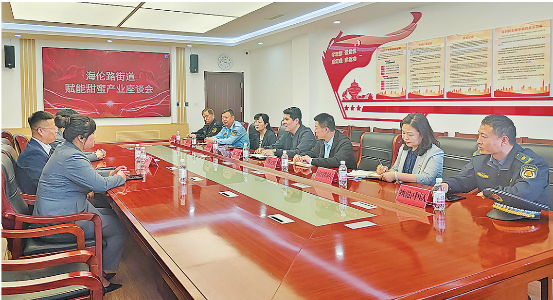
■海伦路街道 举办赋能甜蜜产业 座谈会。