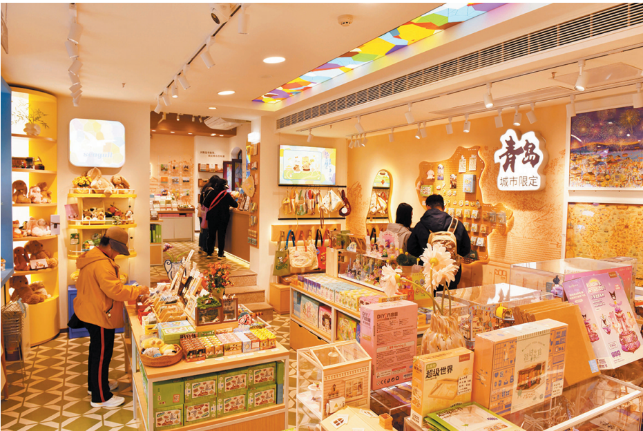
■“猫的天空之城”店内到处是青岛元素。

都刻有鲜明的青岛印记，盖满印章的本子仿佛拓印下整座城市的烟火诗篇。店内文创产品拒绝高冷，主打接地气潮趣，海军节纸雕便签，印着“浪里个郎”方言梗的T恤、价格亲民的冰箱贴等，从各个维度展现老城文化与港口情怀。“盖章盖到本子‘破产’，就是对青岛最深情的告白。”店员打趣道。