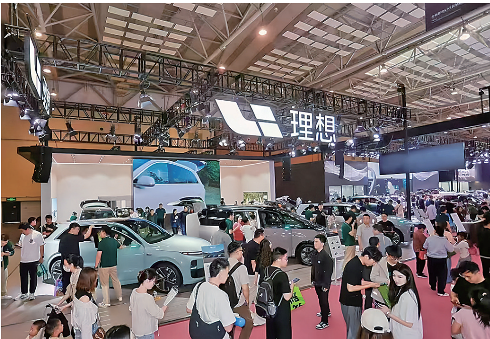
■ 汇聚了10余个汽车品牌的青锋国际汽车城成为热门购车目的地。

“园区转型之初,面临的最大问题是招商。”水清沟街道经济文化服务中心负责人回想起编制《全要素招商服务手册》的日夜,仍历历在目,“街道在2023年成立了营商环境专班、初创企业政策服务站和‘北企