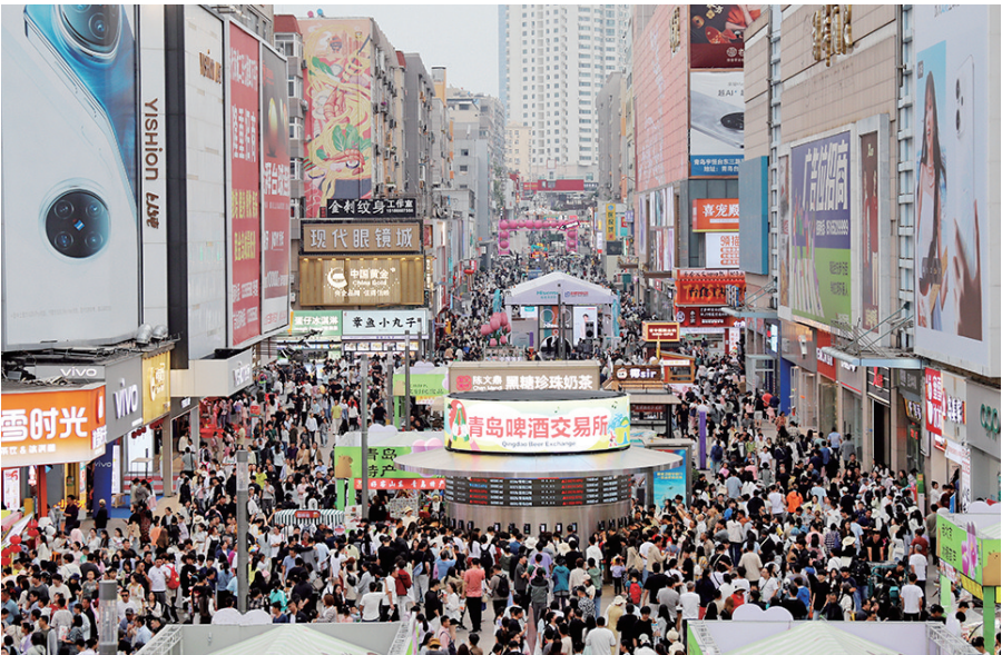
■ 市北区新场景消费引爆文旅打卡热潮。

端午小长假,市北区文旅市场亮点频出:青啤博物馆夜游火爆,沉浸式剧游带游客领略魅力;大鲍岛文化休闲街区内,里院美学出圈,特色市集汇聚美食文创;台东步行街“青交所”开市,独特啤酒交易模式带动消费,释放假日经济活力。