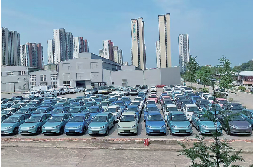
■ 市北区盘活青岛纺机大院闲置资源,打造青锋国际汽车城。

之家’企业服务站,不仅积极对接汽车外展,助力园区车企拓宽市场渠道,还提供政策解读、红利落实、人才招聘、金融支持等全周期服务。”