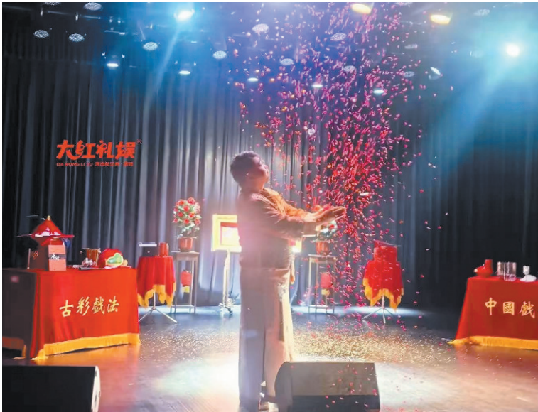
■ 大红礼娱 的古彩戏法表演 引人入胜。