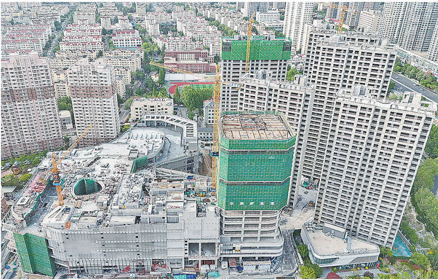
■物美青岛城市更新项目正加紧施工。

□青岛日报/观海新闻记者 余瑞新 实习生 车芳如 本报5月13日讯 记者日前在探访时发现,位于辽阳西路与福州北路交叉路口的物美青岛城市更新项目建设已进入收尾阶段,一座大型商业综合体轮廓初现,高层写字楼和住宅拔地而起。整个项目预计年底竣工,其中商业板块将于9月交付。 物美青岛城市更新项目位于辽阳西路以北、辽源路以南、福辽立交桥以西,占地面积3.71万平方米,规划建设建筑面积22万平方米,总投资约34亿元,规划建设商业综合体、23层写字楼和5栋高层住宅。该项目所在地原为市民经常光顾的迪卡侬、百安居,作为市北区盘活低效片区的重点项目、产城融合示范项目,于2023年启动更新建设。 “目前,商业板块地上主体建设已进入