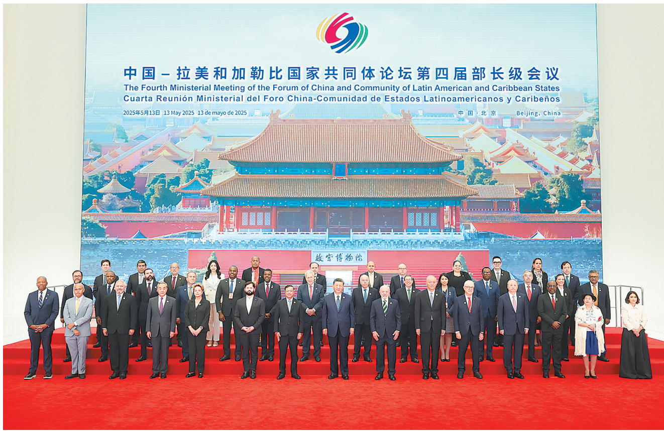
5月13日上午,国家主席习近平在北京国家会议中心出席中国-拉美和加勒比国家共同体论坛第四届部长级会议开幕式并发表主旨讲话。这是习近平同与会嘉宾集体合影。