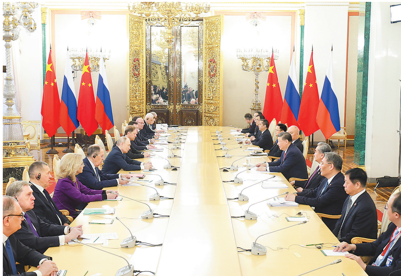
当地时间5月8日上午,俄罗斯总统普京同中国国家主席习近平在莫斯科克里姆林宫举行会谈。这是两国元首举行小范围会谈。

■当前,面对国际上的单边主义逆流和强权霸凌行径,中方将同俄方一道,肩负起作为世界大国和联合国安理会常任理事国的特殊责任,挺身而出,共同弘扬正确二战史观,维护联合国权威和地位,坚定捍卫二战胜利成果,坚决捍卫中俄两国及广大发展中国家权益,携手推动平等有序的世界多极化、普惠包容的经济全球化