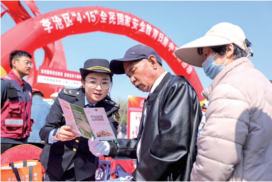
■在青岛全民国家安全教育周系列活动中,工作人员向市民宣讲国家安全知识。

和互动性,让国家安全教育融入市民日常生活。青岛市总工会创新开展“全市职工国家安全知识网上对抗赛”,依托“齐鲁工