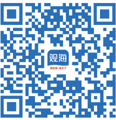
扫码阅读实施细则

按照个人提交的二孩、三孩申请,经卫健部门审核认定的多子女家庭,符合二孩规定的发放5万元购房补贴,符合三孩规定的发放10万元购房补贴。补贴款由新购房屋所在的区(市)政府按规定发放至提交申请时预留的个人银行账户中。