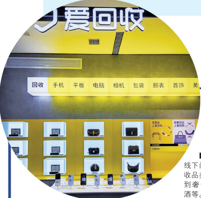
■爱回收线下门店的回收品类已扩展到奢侈品、名酒等。