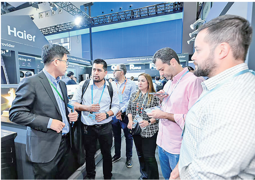
■境外采购商在海尔展台前咨询。

作为“中国外贸风向标”,走过68年的广交会,其意义已远超一般展会。在世界经济不稳定不确定性增多的大背景下,本届广交会仍是万商云集、万众期待。本届广交会分三期举办,分别以“先进制造”“品质家居”“美好生活”为主题,共设55个展区、172个产品