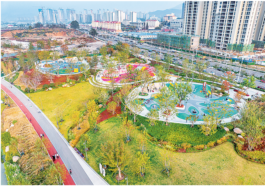
▲张村河片区加速蝶变焕新。