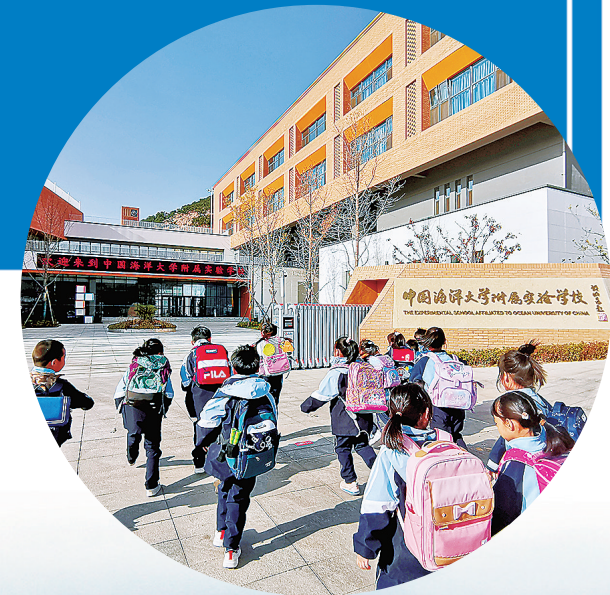
■中国海洋大学附属实验学校启用。

“城,所以盛民也;民,乃城之本也。”4月14日上午,记者从崂山区举行的城市更新和城市建设三年攻坚行动总结表彰大会上获悉,2022年以来,该区累计实施了总投资1566亿元的366个重点项目,推动搁置多年的张村河片区、王家村等城中村难题得到了历史性解决,跨海大桥连接线二期、辽阳路东西快速路等一批重大交通设施建成投用,老旧小区改造、城市公园和停车场等一批惠民工程落地见效,违法建设、未贯通路等一批顽瘴痼疾得到有效解决,目前已有301个项目顺利完工,推动城市功能、品质、活力实现历史性跃升,探索出一条城优、产强、情暖的高质量发展路径,奏响了中国式现代化崂山实践的澎湃乐章。