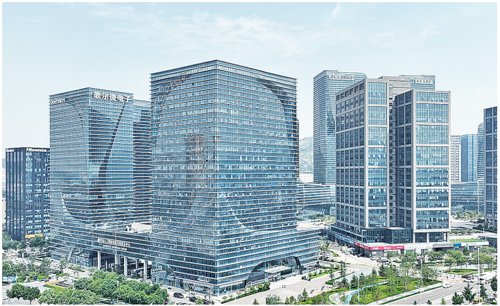
▲一批人工智能领域的大项目、好项目加速向青岛市人工智能产业园集聚。