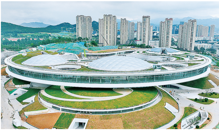
▲青岛虚拟现实创新中心项目。