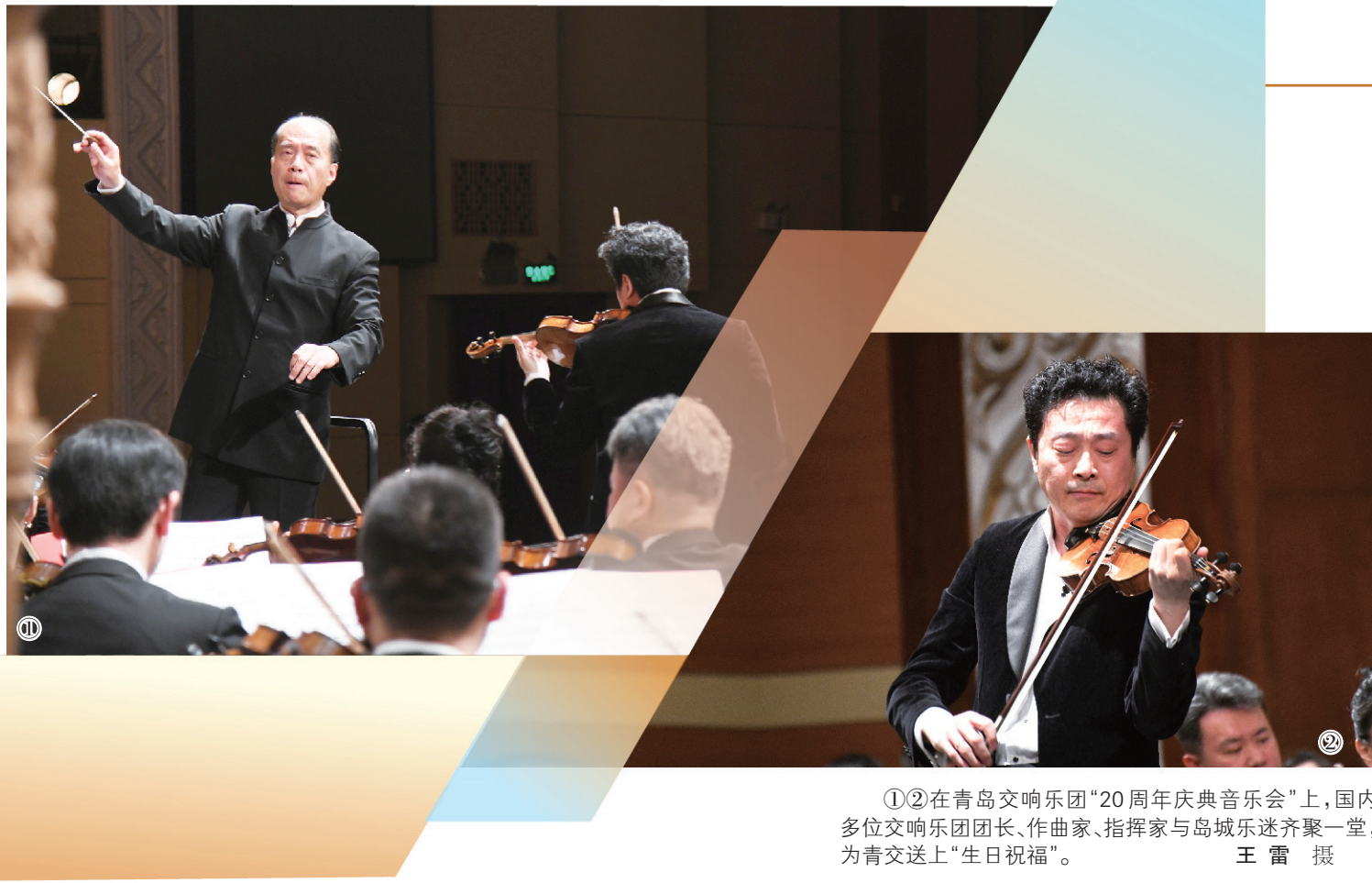
①②在青岛交响乐团“20周年庆典音乐会”上，国内多位交响乐团团长、作曲家、指挥家与岛城乐迷齐聚一堂，为青交送上“生日祝福”。