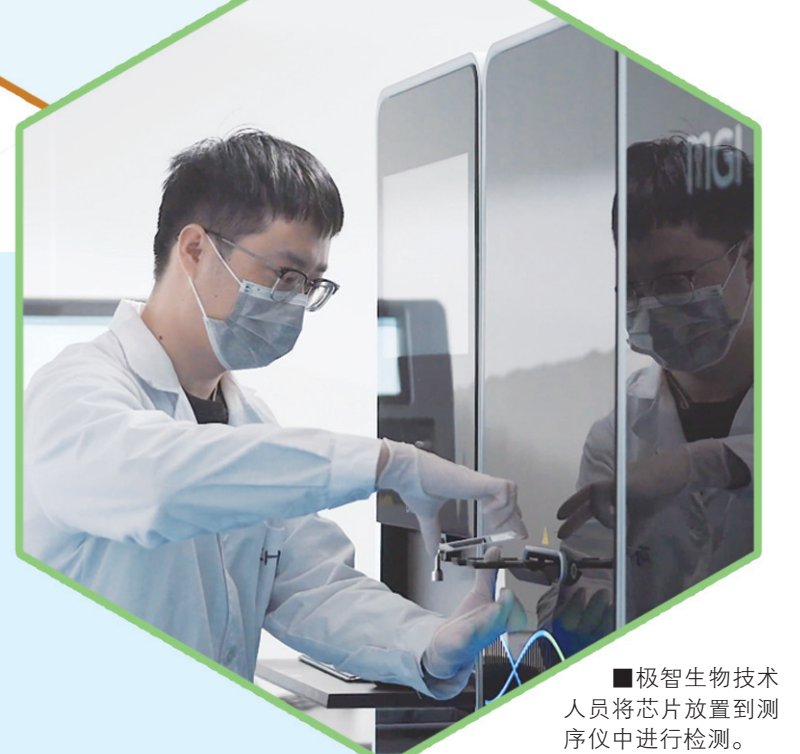
■极智生物技术人员将芯片放置到测序仪中进行检测。

康复医疗器械赛道：拥有康复大学、青岛康复产业孵化器等资源优势，集聚了康道医疗、正仁慧康、形康三维、安德薄科技等一批康复医疗器械企业