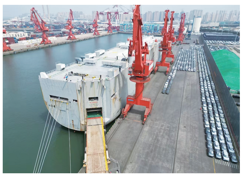
新能源汽车准备装船。

青岛大港口岸是重要的综合性货物码头，近年来多服务于共建“一带一路”重点项目货物出口、自主品牌大型工程机械、车辆出口，具备扎实的业务基础和良好的设施条件。随着口岸新能源汽车出口量逐年增加，港口物流疏运、场地存储等压力也随之增加，如何提高通关效率成为出口企业颇为关注的问题。针对新能源汽车的特殊性，海事执法人员靠前一步，提前掌握