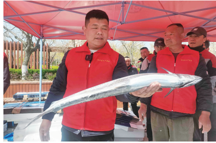
鲅鱼节线上线下预订和销售火爆。

□青岛日报/观海新闻记者 张晋 黄光丽 本报4月13日讯 伴随满载春鲅鱼的渔船破浪归来，青岛人最期待的那一口“春鲜”终于上岸了。13日上午，“乡村好时节·游购乡主题”年活动——青岛2025第二十一届沙子口鲅鱼节开幕，千余市民游客踏春而来，鲅鱼节线上线下预订和销售火爆。