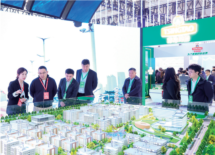
■嘉宾参观中国—上海合作组织生态环保创新基地(山东)沙盘。