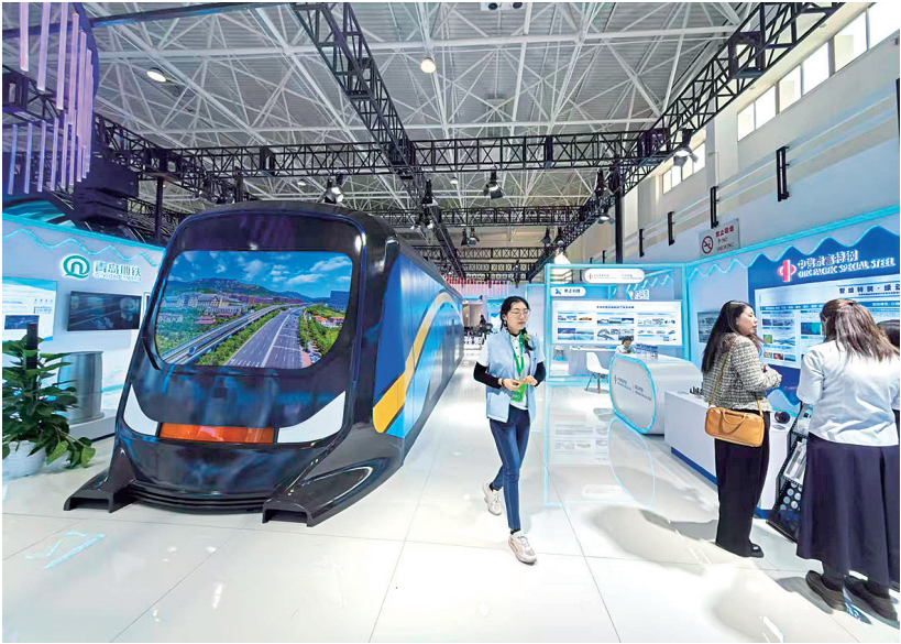
■青岛地铁展出了全球首列碳纤维地铁列车外壳模型。