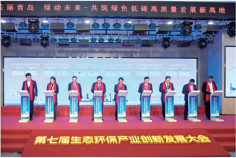
■在青岛主场日活动中，举行合作项目签约仪式。

借助展会的东风，青岛生态环保产业将积极践行“两山”理念、服务“双碳”战略，加快绿色科技创新和先进绿色技术推广应用，做强绿色制造业，发展绿色服务业，壮大绿色能源产业，发展绿色低碳产业和供应链，构建绿色低碳循环经济体系，开创生态环保产业高质量发展的绿色未来。